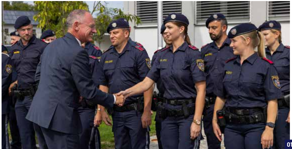
01 Innenminister Karner begrüßte die Belegschaft.

Die neue Polizeiinspektion in Tumeltsham wurde im ehemaligen Gemeindeamt im Ortszentrum errichtet. Karner betonte: „Die Dienststelle liegt örtlich und strategisch in unmittelbarer Nähe zur Autobahn A8 und diversen Bundesstraßen. Von der Polizeiinspektion müssen rasch alle Richtungen angesteuert werden können – der neue Standort ist hierfür ideal.“