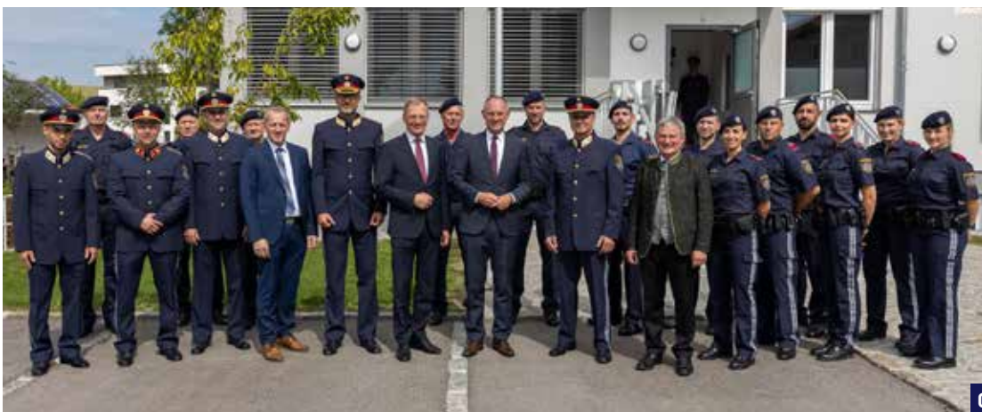
02 Die gesamte Delegation beim gemeinsamen Erinnerungsfoto.