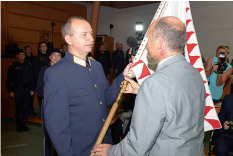
Konrad Kogler erhält von Innenminister Wolfgang Sobotka die niederösterreichische Korpsfahne