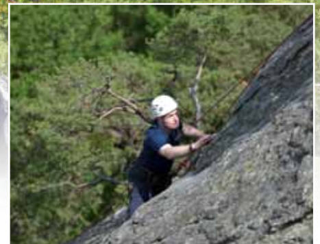
Bei der Kletterstation ging es steil bergauf!

Nach dem Antreten in den Morgenstunden ging die erste Hälfte der Teilnehmer direkt ins nahe Waldgebiet der Ruine Dürnstein ab. Die zweite Hälfte der EE-Bediensteten startete mit den Stationen Einsatzstock (ES) und Technik. Danach wurden die Stationen gewechselt.