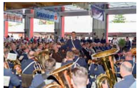
Musikalische Umrahmung durch die Polizeimusik NÖ im vollgefüllten Feuerwehrhaus