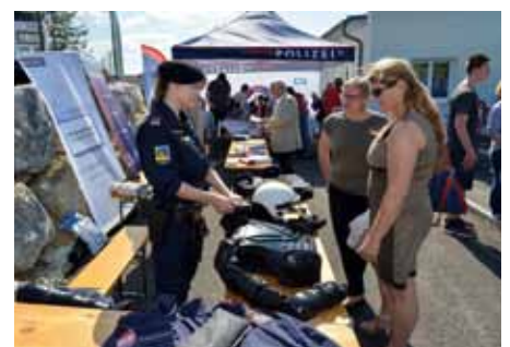
Info-Stand der Einsatzeinheit NÖ