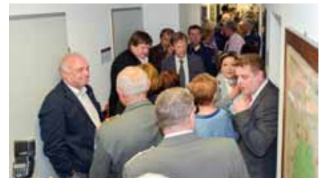
Großes Gedränge bei der Besichtigung der neuen Polizeiinspektion