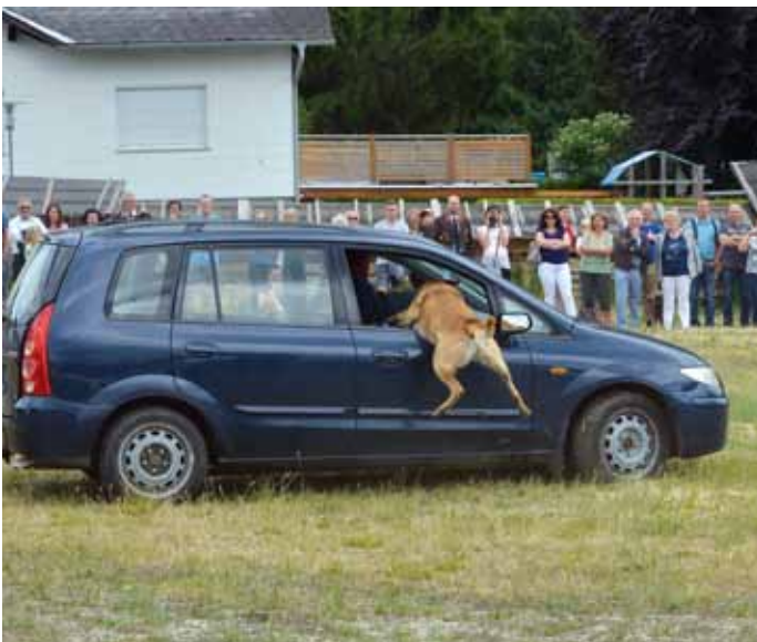
Der Diensthund zeigt jedoch keinerlei Angst und attackiert den Täter