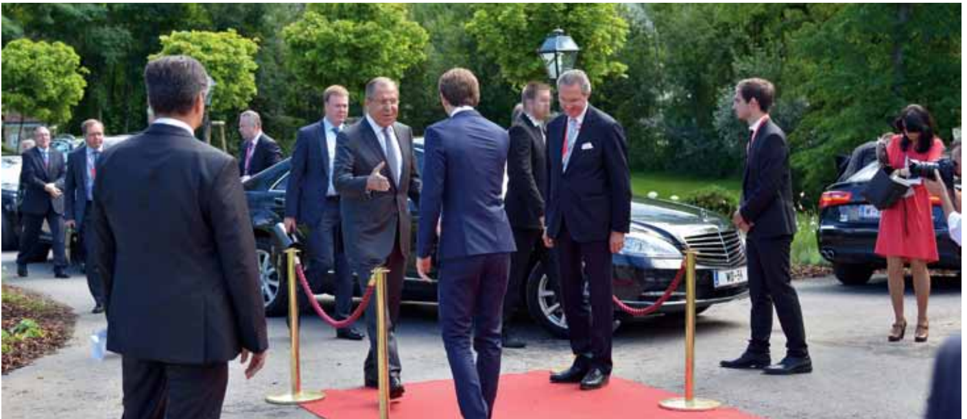
BM Sebastian Kurz begrüßt den russischen Außenminister Sergei Lawrow