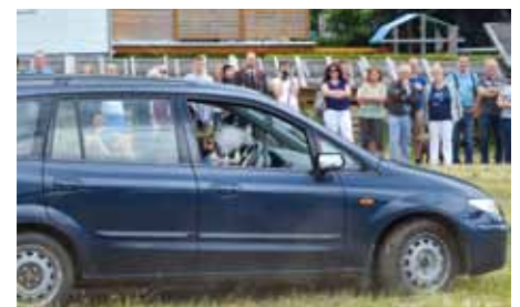
Bankräuber schießt bei Straßensperre auf Polizei