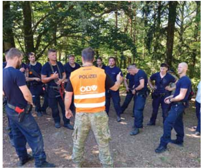
Nachbesprechung mit Einsatztrainer