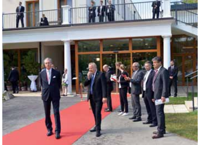
Bedienstete des LVT NÖ und BMfEIA beim Empfang der Delegationen