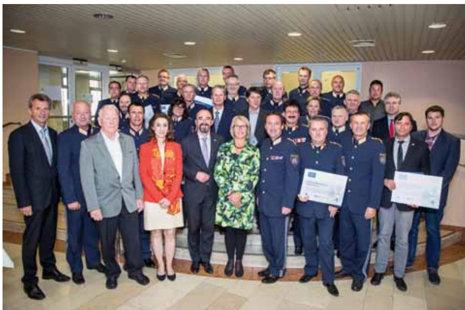
Zertifikatsübergabe im Innenministerium.