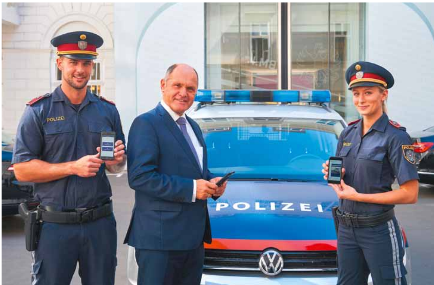
Für Innenminister Wolfgang Sobotka ist moderne und innovative Polizeiarbeit ein Muss.

Sobotka: Seit Anfang August 2017 laufen Probetriebe in Wiener Neustadt und Wien mit großem Erfolg. Im September 2017 erfolgt die Auslieferung von 2.800 Smartphones und 3.500 Tablets an die Polizeiinspektionen. Kontinuierlich sollen bis Dezember 2019 alle Polizistinnen und Polizisten ausgestattet sein. Hierbei sprechen wir von über 30.000 Telefonen.