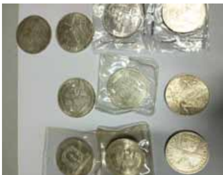
Diebesgut – Silbermünzen

Der kolumbianischen Tätergruppe wurden nach dem Ermittlungserfolg der Diebstahlsgruppe des Landeskriminalamtes Niederösterreich bisher vier Wohnhauseinbrüche, vier Wohnungseinbrüche, ein versuchter Wohnungseinbruch und eine gefährliche Drohung gegen einen Justizwachebeamten im Zuge der U-Haft zugeordnet werden.