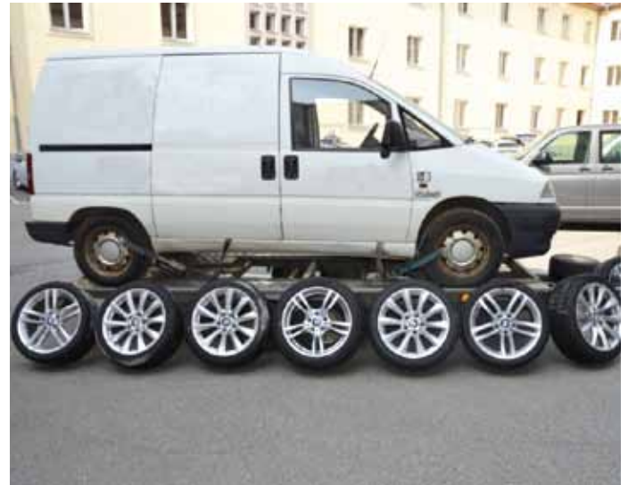
Diebesgut - Kompletträder

und arbeitsteilig vor, indem sie ihre Opfer und deren Lebensgewohnheiten genau ausspionierten.