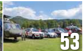
Tag der regionalen Einsatzorganisation