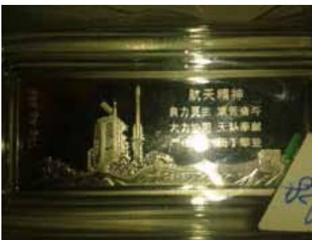
Diebesgut – Silberbarren

Der Wert der Beute – hauptsächlich hochwertige Uhren, Designertaschen, Schmuck und Bargeld – beläuft sich auf ca. 450.000 Euro. Die Sachschadenssumme wird mit etwa 10.000 Euro beziffert.