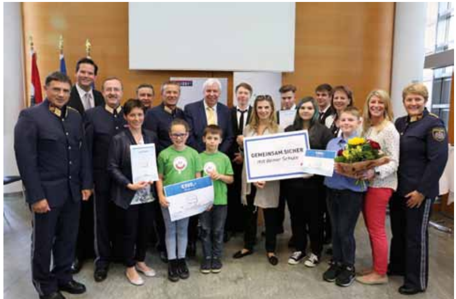
Die erfolgreichen Gewinner