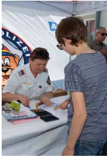
Stand der Kinderpolizei