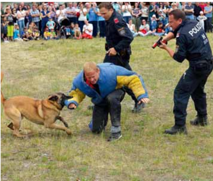
... und kann schließlich festgenommen werden.