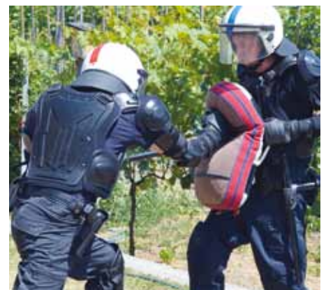
Voller Einsatz bei den Stationen „Einsatzstock“ und „Technik“

Ausgehend von der FF Dürnstein erreichten die Einsatzkräfte nach einem ca. 40 Minuten dauernden Orientierungsmarsch die Station „Ersthelfer“. Bei dieser Station wurden die Kollegen über die Fähigkeiten und Kenntnisse der in der EE NÖ bereits implementierten „Ersthelfer“ und deren Ausrüstung aufgeklärt. Im Einsatzfall soll