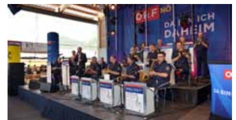
Im Zelt sorgte die Big Band der Polizeimusik NÖ für Unterhaltung