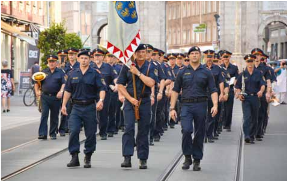
Fahnengruppe und Musikkapelle der Polizei NÖ

kapelle um 11:00 Uhr eine Kostprobe ihres musikalischen Könnens in der Innsbrucker Altstadt beim „Goldenen Dachl“. Um 15:00 Uhr und 17:00 Uhr folgten an gleicher Stelle die Auftritte der Polizeimusikkapellen aus Salzburg und Wien vor vielen begeisterten Gästen.