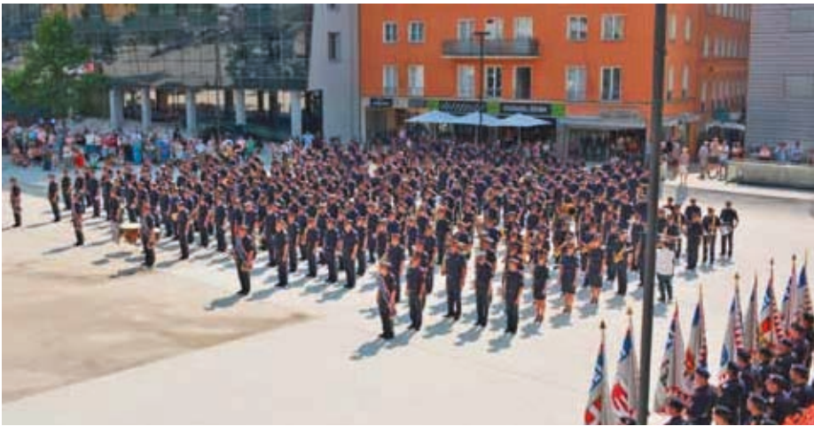
Die neun Polizeimusikkapellen mit den Fahnenabordnungen aller Landespolizeidirektionen Österreichs beim landesüblichen Empfang und dem anschließenden Showprogramm am Landhausplatz in Innsbruck

Die Polizeimusikkapellen aller neun Landespolizeidirektionen hinterließen beim Österreichischen Polizeimusiktreffen am 21. und 22. Juni in Tirol einen ausgezeichneten und bleibenden Eindruck beim Publikum und den teilnehmenden Festgästen. Viele begeisterte Zuschauer und Freunde der Blasmusik besuchten die einzelnen Veranstaltungen der Polizeimusiken.