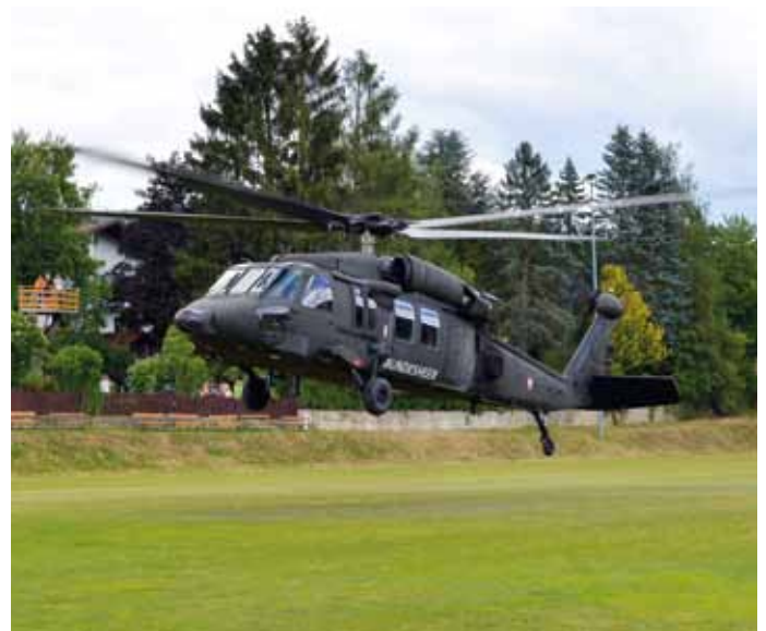
Der Black Hawk startet zur Löschübung