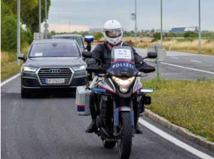
Lotsung einer Delegation durch LVA