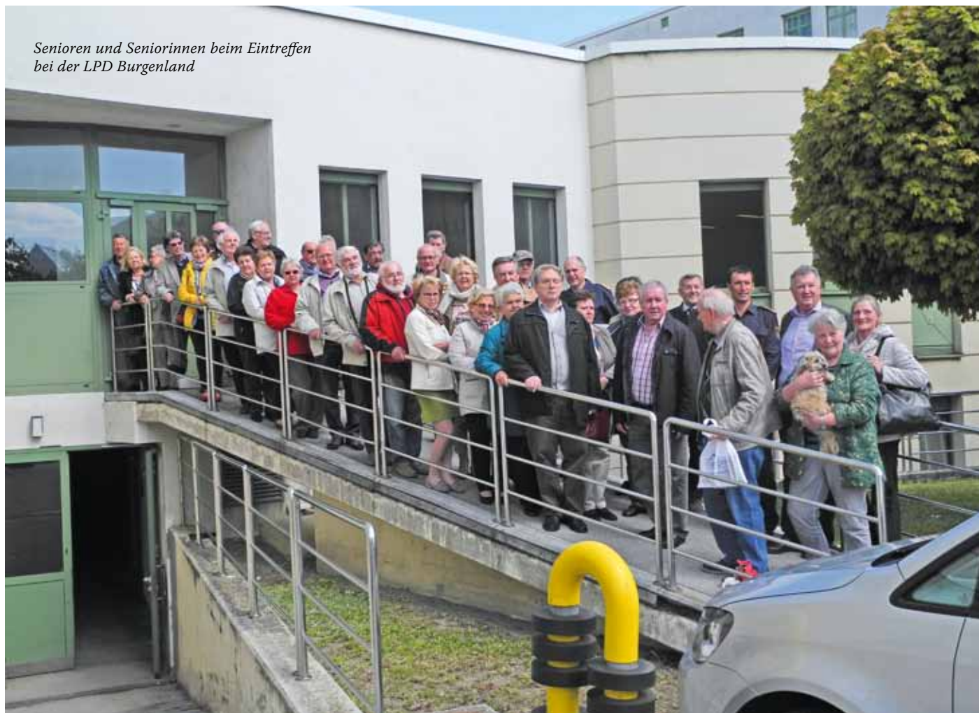
Senioren und Seniorinnen beim Eintreffen bei der LPD Burgenland