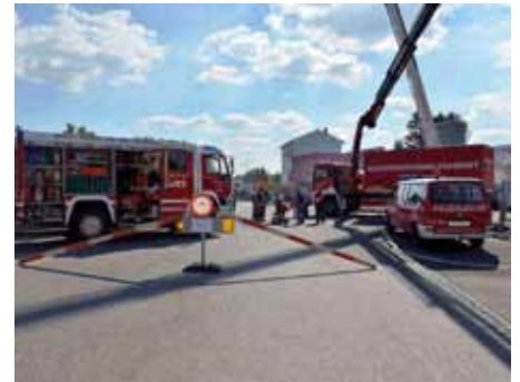
Geräteschau der FF Mannersdorf vor dem Feuerwehrhaus