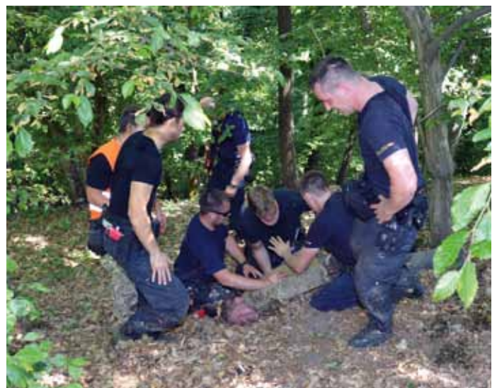
... und anschließender Festnahme

bis zum Eintreffen der Rettungskräfte rasche Soforthilfe noch direkt im Einsatzgebiet ermöglicht werden.