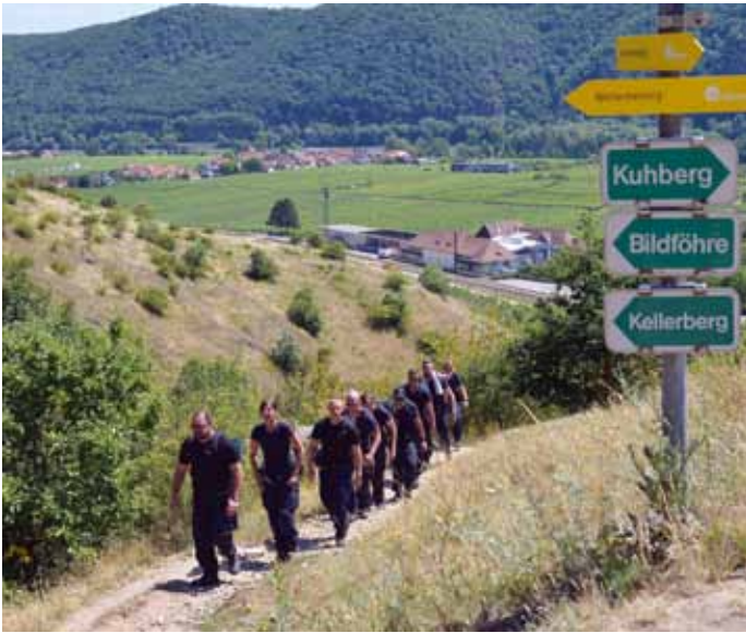
Anmarsch zu den Stationen