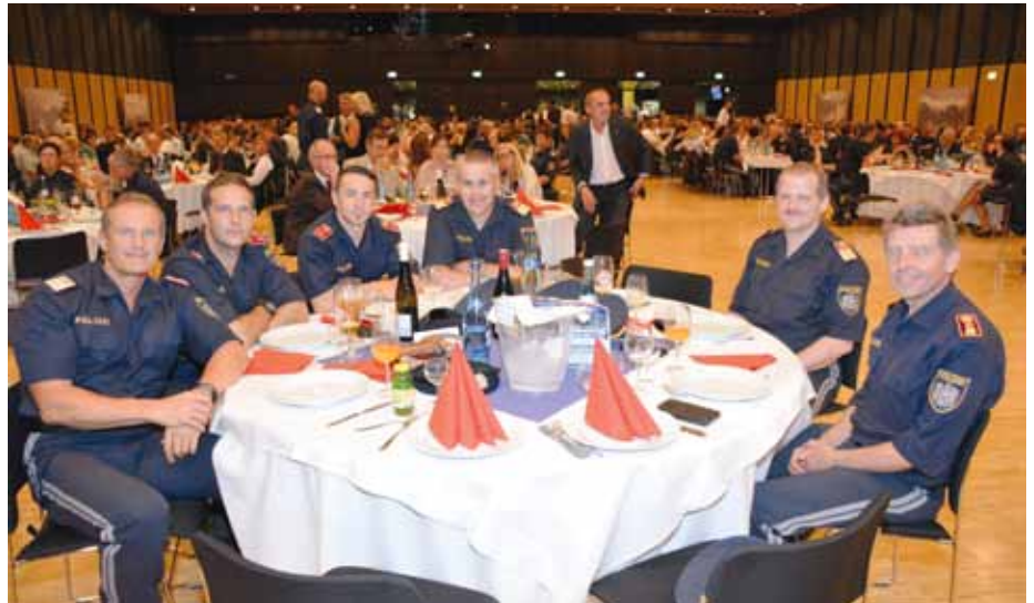
Ehrengäste der Polizei NÖ

„Musik ist eine Sprache, die auf der ganzen Welt verstanden wird. Mu-