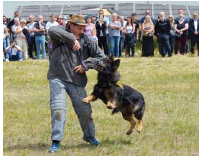
Der „Hühnerdieb“ wird gestellt