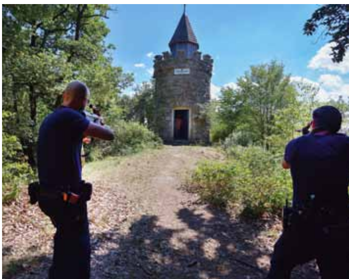
Annäherung zur Starhembergwarte mit Täterkontakt...