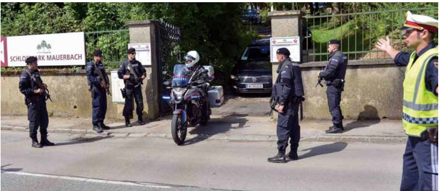
EE-NÖ sichert Abreise einer Delegation