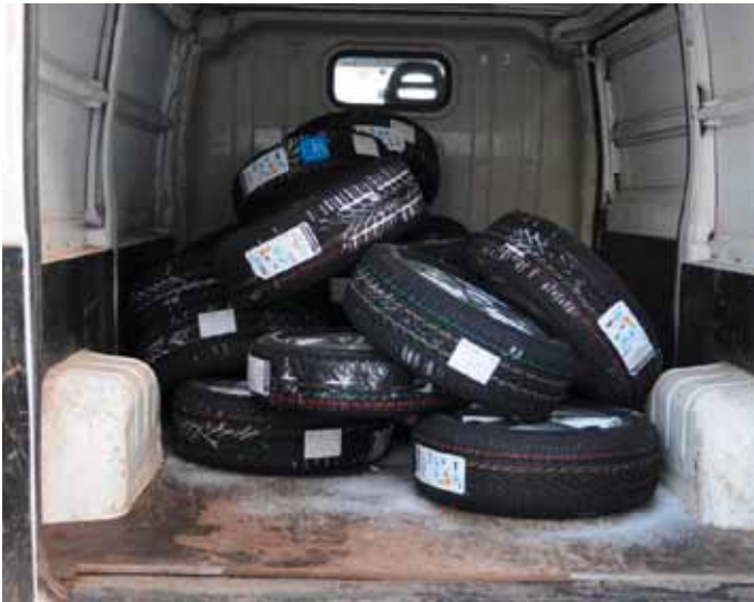
Diebesgut – Reifen