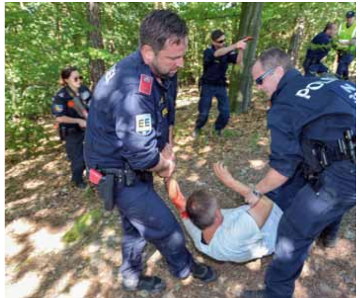
Taktiksequenz im Wald nahe der Starhembergswarte mit Bergung eines Verletzten