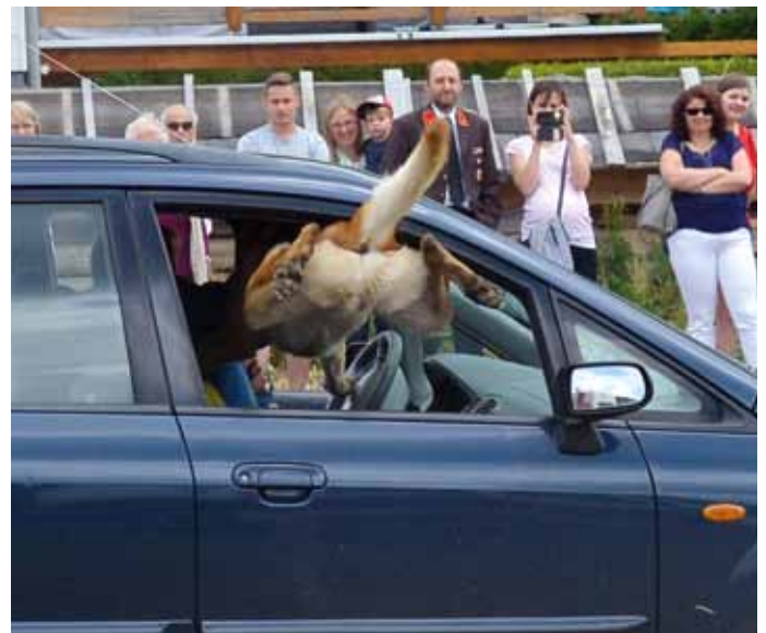
... verbeißt sich in ihm ...