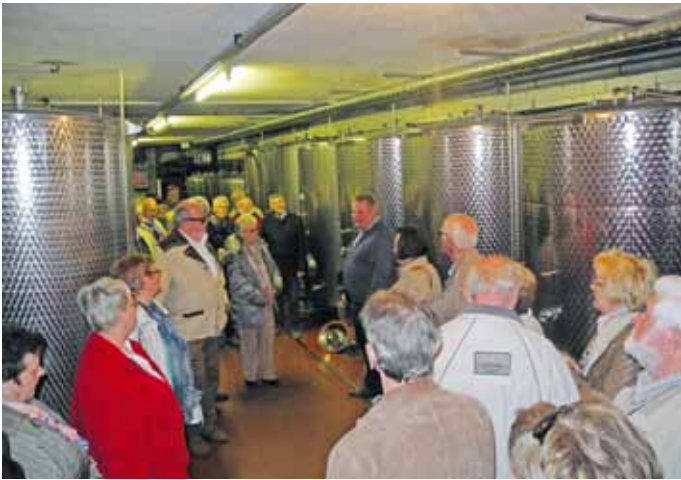
Weinverkostung beim Weingut Fischl-Kranixfeld