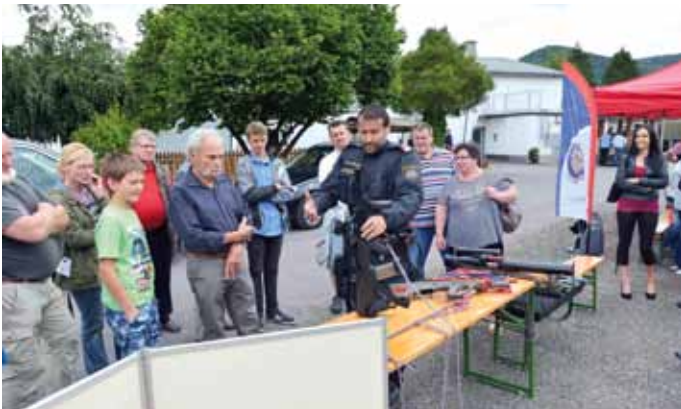
Reges Interesse bei den Informationsständen der Polizei