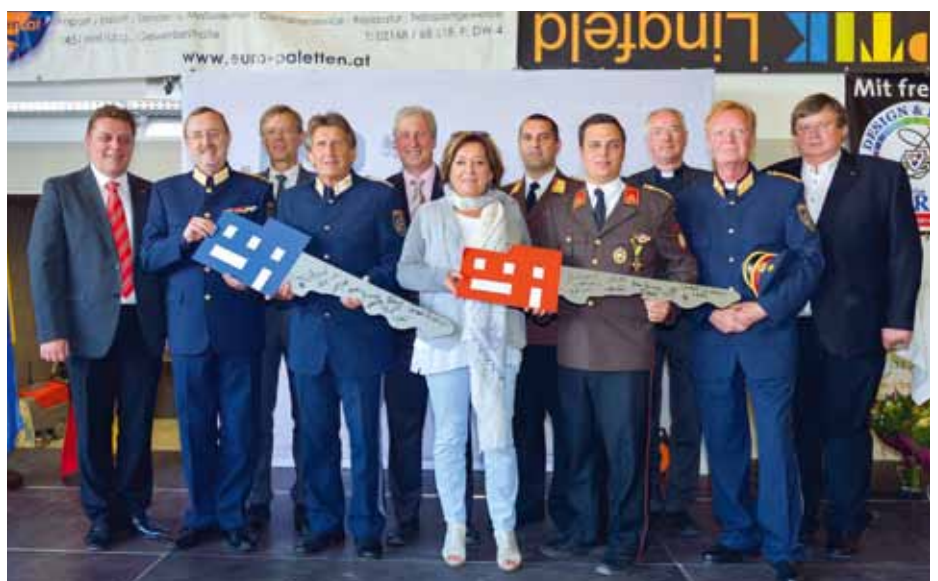
Ehrengäste bei der Schlüsselübergabe an die beiden Kommandanten