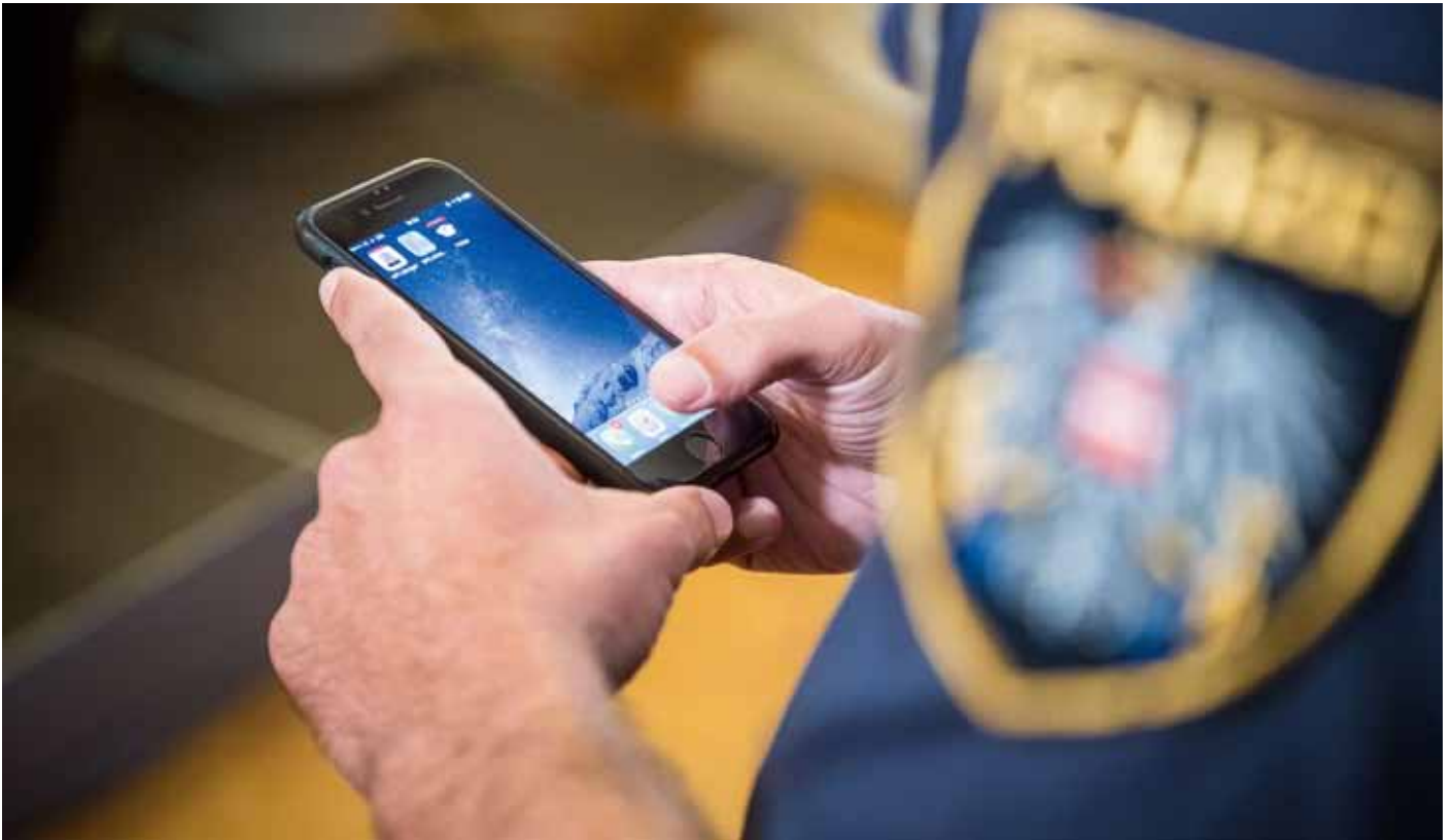
Kontinuierlich sollen bis Dezember 2019 alle Polizistinnen und Polizisten mit Smartphones ausgestattet sein.