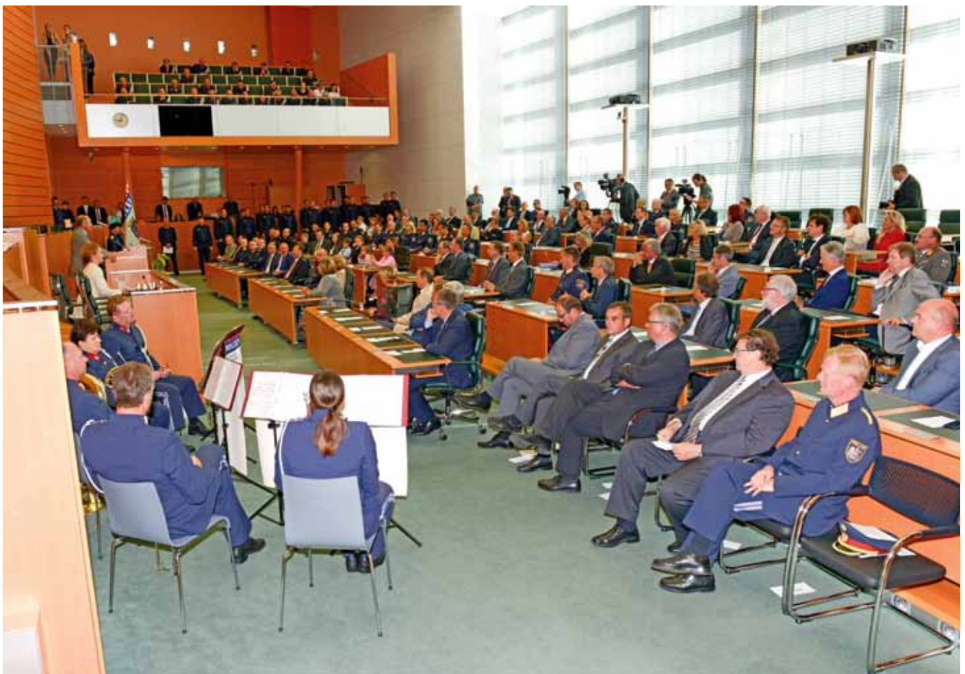
Ehrengäste im NÖ Landtagssitzungssaal