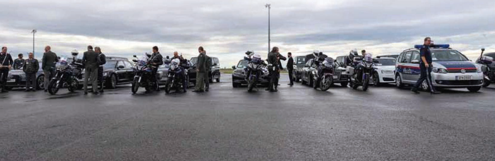
Lotsen- und Delegationsfahrzeuge in Warteposition