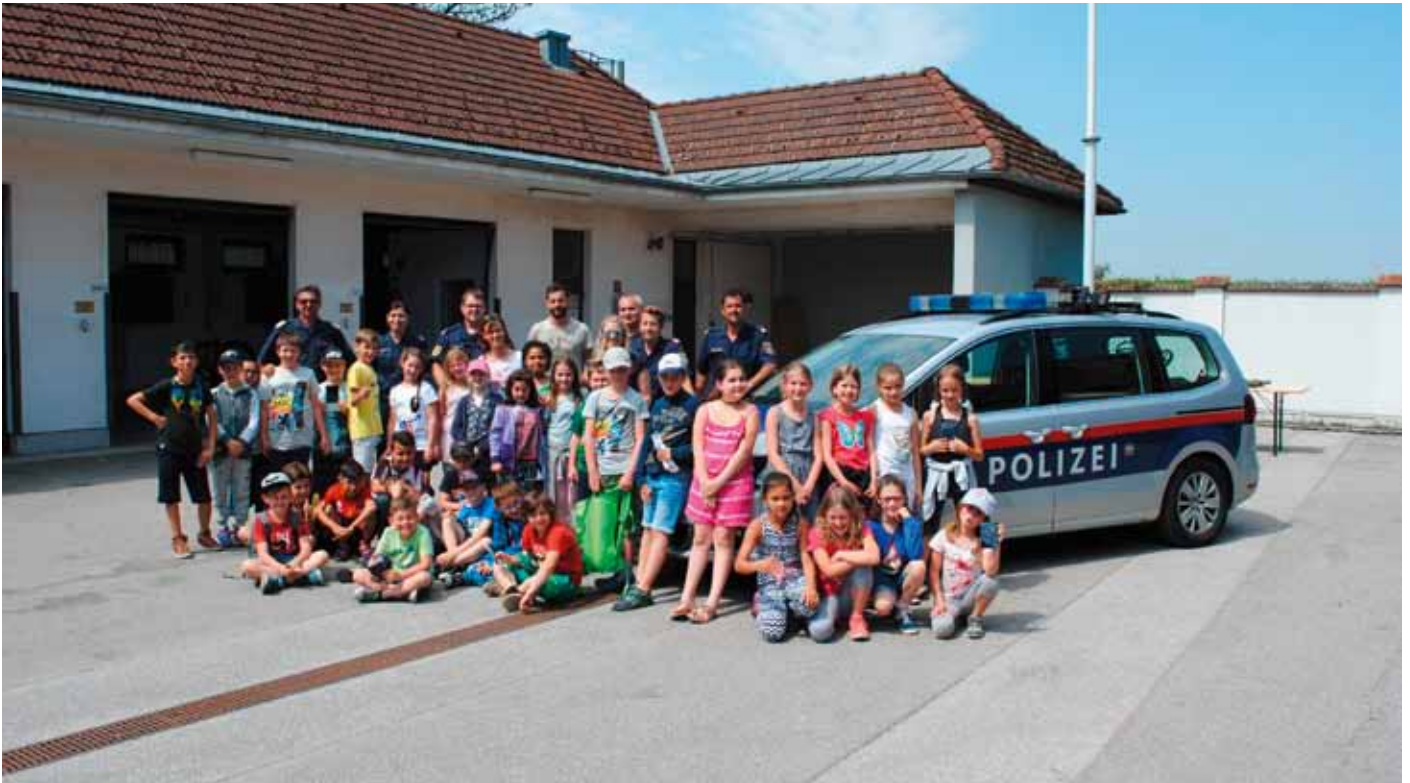
Lehrer und Kinder der Volksschule Öhling mit Beamten der API Amstetten