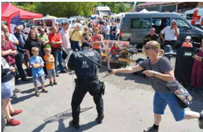
... wo man auch Gelegenheit hatte, die Ausrüstung der Einsatzeinheit zu testen