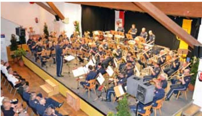
Im Gemeindesaal von Aldrans konnten die Polizeimusiken aus Niederösterreich und dem Burgenland die Konzertbesucher mit ihren Klängen überzeugen.

Zum Auftakt der Konzertreihe gab die Polizeimusik Tirol als Gastgeber-